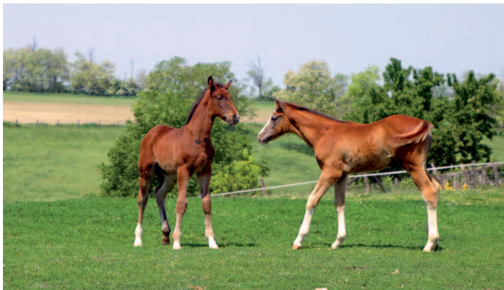
Ustinov és Lupicor apaságú csikók , a jövő generációját képviselik Sáripusztán